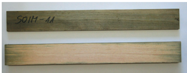
Rys. 1. Próbkę impregnowanego drewna sosnowego (nr próbki SOIM-11). Na górze pokazano powierzchnię zewnętrzną, a niżej – powierzchnię wewnętrzną po przecięciu

Właściwości materiałowe dla prostopadłego kierunku prędkości skrawania względem włókien drewna, wiążkość R_{\perp} (energii właściwą niezbędną do wytworzenia pęknięcia o powierzchni jednostkowej w trakcie skrawania – ang. fracture toughness ) oraz naprężenia tnące w strefie ścinania \tau_{\gamma_{\perp}} , które wykorzystano do prognozowania wartości mocy skrawania (tabl. I), określono według metodologii opracowanej przez Orłowskiego i opisanej w pracach [11, 13] z wykorzystaniem testów skrawalnościowych na pilarsce ramowej PRW15M z eliptyczną trajektorią ostrzy oraz hybrydowym, dynamicznie wyrównoważonym układem napędowym [15].