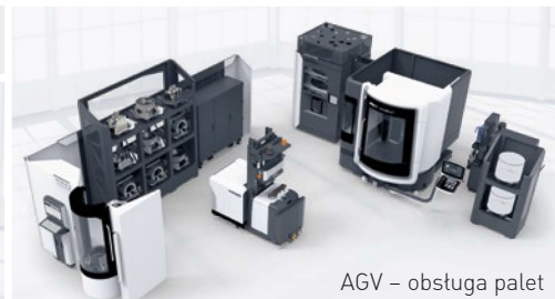
AGV – obsługa palet ze swobodnym dostępem do obrabiarki