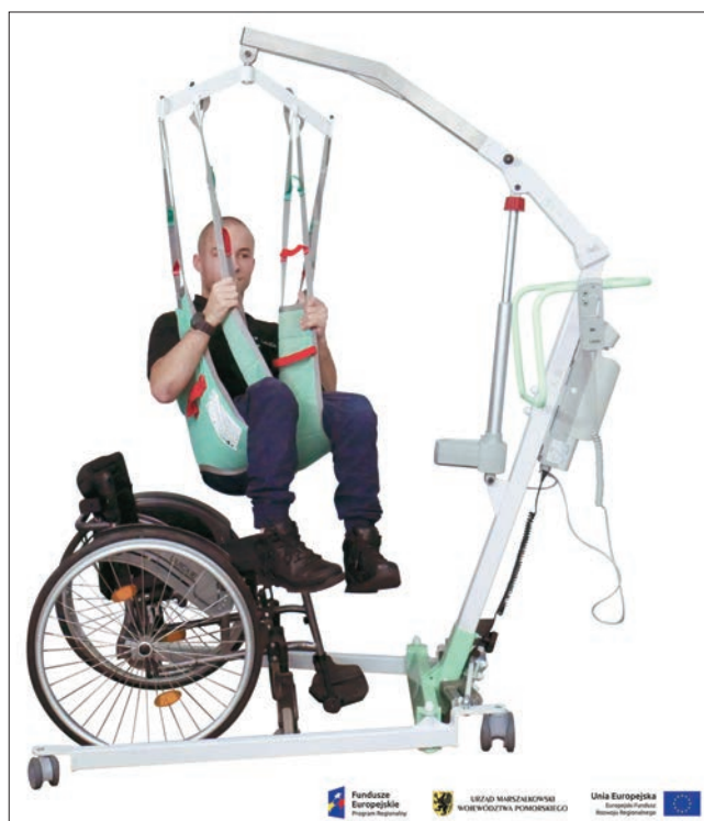
Fig. 2. LeviCare J160 mobile lift Rys. 2. Podnośnik jezdny LeviCare J160

Podnośnik jezdny (rys. 2) powstał dzięki finansowaniu ze środków Unii Europejskiej. Jak sama nazwa wskazuje, jest to podnośnik mobilny, dotychczas naj-