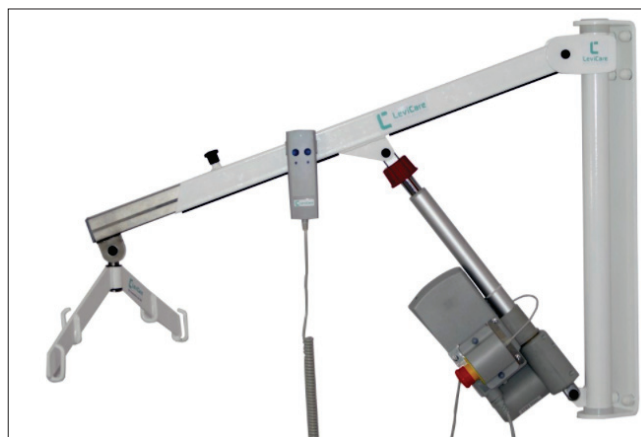
Fig. 4. LeviCare Q140 wall lift for the disabled Rys. 4. Podnośnik ścienny dla osób niepełnosprawnych LeviCare Q140

Choć podnośnik jest nazywany ściennym, nie jest to jedyny sposób jego montażu. W zależności od warunków architektonicznych mieszkania lub placówki dobierane są odpowiednie techniki montażowe, bez przeprowadzania modernizacji budowlanych. Niewątpliwą zaletą konstrukcji jest też wszechstronna możliwość regulacji podnośnika, dzięki czemu dopasowuje się go do potrzeb użytkowników, np. regulacja długości ramienia czy dobór wysokości podstaw mocujących. Podnośnik jest również wyposażony w systemy bezpieczeństwa, które stosuje się w sytuacjach mogących stwarzać zagrożenia dla osoby podnoszonej.